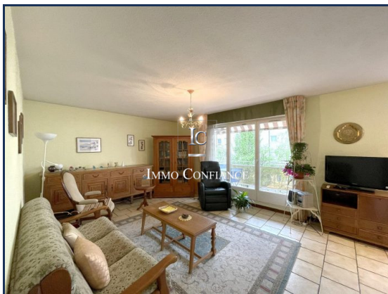
SALON VUE 1